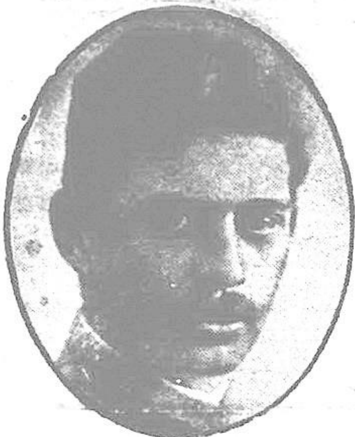
M. S. Regele Carol al II-lea

Suntem informați că în prima jumătate a lunii August, M. S. Regele Carol al II-lea, va veni la Constanța, luând reședința la palatul regal dela Mamaia.